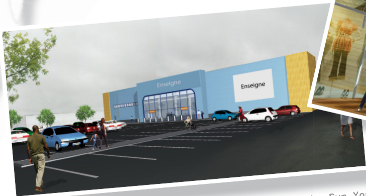
Bâtiment Commercial - 85 - La Roche Sur Yon

cours pour nos équipes de Cholet : c'est la construction d'un vaste centre commercial au coeur du Parc de l'Ecuyère à Cholet. A l'initiative du promoteur OREAS, «L'autre Faubourg» va regrouper une trentaine de cellules commerciales, sur unesurfacetotaledede27500m 2 couverts. Ouverture du centre commercial fin mars 2010.