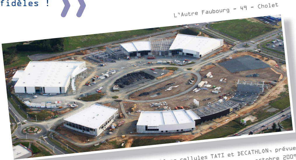
L'Autre Faubourg - 49 - Cholet

D'autres enseignes commerciales, font appel aux services de notre groupe : nous collaborons déjà avec Intermarché et Leclerc pour la réalisation de plusieurs surfaces de vente, avec le groupe Carrefour pour la construction de nombreux magasins SHOPI, ou encore, avec Aldi, Lidl et Jouetland, et autres enseignes de l'équipement de la maison et de la personne..