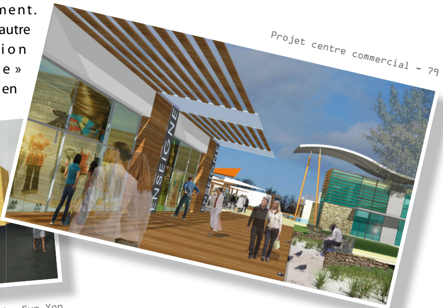
Projet centre commercial - 79